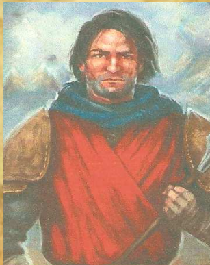
Ich bin zurück

Lies diese Karte, sobald Derfel mind. einen Stein auf Feld 0 abgelegt hat.