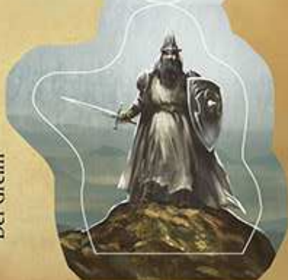
Der Eiserne König