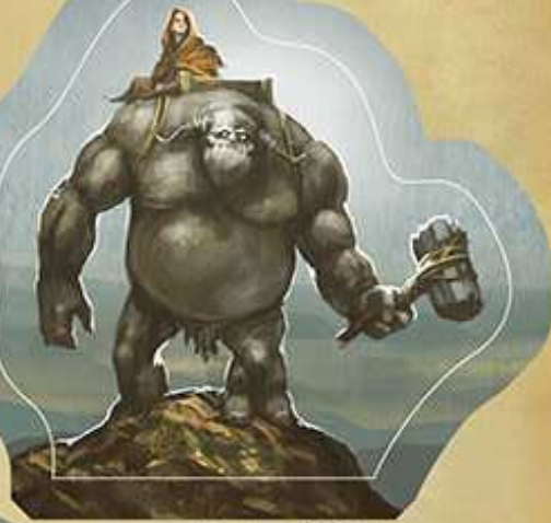
Brut und Hella