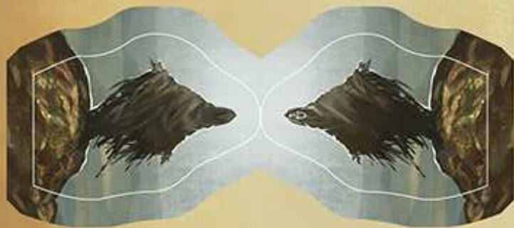
Die drei Schwestern