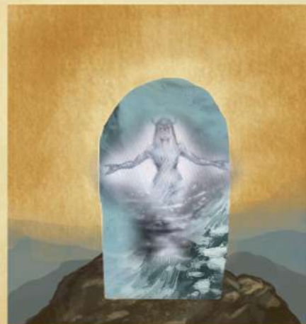
Ihr könnt die Figur „Siantari“ aus „Verschollene Legenden – Alte Geister“ als Sela Heldenfigur verwenden.

Sela benötigt die Schneeplättchen aus „Die Reise in den Norden“. Falls die Legende ebenfalls Schneeplättchen verwendet, so hat diese Vorrang und Sela zieht aus den übrigen Schneeplättchen. Erfahrt mehr zu Sela's Sonderfähigkeit und der Funktionsweise der Schneezauber auf den Karten „Sela's Sonderfähigkeit 1“ und „Sela's Sonderfähigkeit 2“.