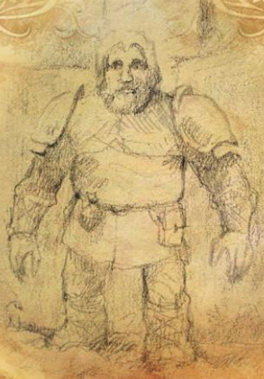
Der infizierte Held 2

Der infizierte Held muss ENTWEDER einen Brunnen leeren , ODER einen halben Trank der Hexe zu sich nehmen. Danach kann er sich wieder ohne Willenspunktverlust oder zusätzliche Stunden bewegen. Der Brunnen gibt keine Willenspunkte und der Trank der Hexe hat keinen Effekt im Kampf wenn er zur Heilung eingesetzt wird. Der Effekt von Brunnen und Trank der Hexe hält nur für diesen einen Tag an. Nach dem nächsten Sonnenaufgang kosten die Stunden wieder zusätzliche WP.