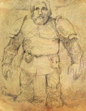
Der infizierte Held 4